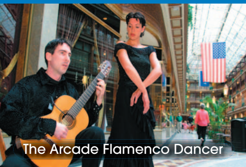
The Arcade Flamenco Dancer

de restaurants construits au cœur d'un bel ensemble architectural et de jardins. Pour faire de bonnes affaires, allez à l'Aurora Outlet ou à Lori Prime Outlet où vous trouverez de nombreux magasins d'usine.