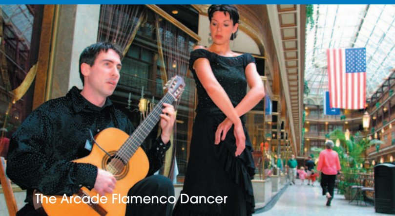
The Arcade Flamenco Dancer

Localizados no Rio Detroit e a três horas de Cleveland. Visite aí o Museu Henry Ford e a Vila Greenfield ou aproveite os melhores shoppings e cassinos da cidade. Faça uma viagem ao Lago e desfrute na belíssima costa oeste de Michigan.