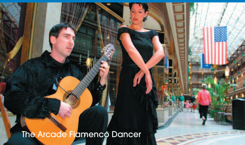
The Arcade Flamencó Dancer

Descubra Detroit y el Lago Michigan, ubicados a tres horas de Cleveland, y junto al Río Detroit. Visite el Museo de Henry Ford y Greenfield Village, o diviértase con los grandes casinos y centros comerciales de la ciudad.